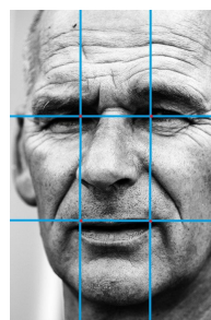
Le fonctionnement de la règle des tiers